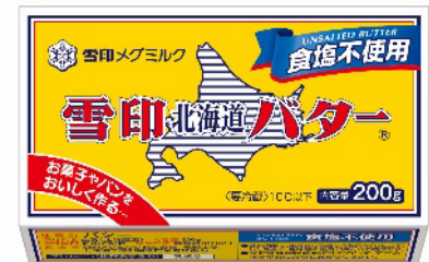
上：『雪印北海道バター』(200g)