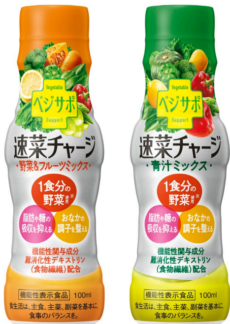
左『ベジサポ 速菜チャージ 野菜&フルーツミックス』（100ml）