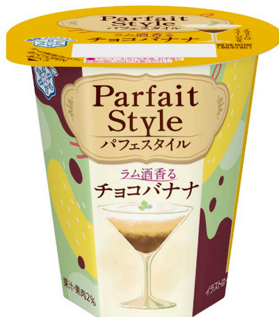
『Parfait Style ラム酒香るチョコバナナ』(110g)