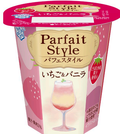
『Parfait Style いちご&バニラ』(110g)