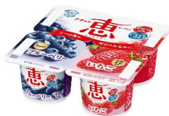
「ブルーベリー+いちご」 (70g×4個)

このたび、「ブルーベリー+いちご」と「アロエ2つのおいしさ」の中身のリニューアルを実施します。併せて、シリーズ全商品を通じて商品特徴をよりわかりやすくお伝えするために、パッケージデザインをリニューアルします。