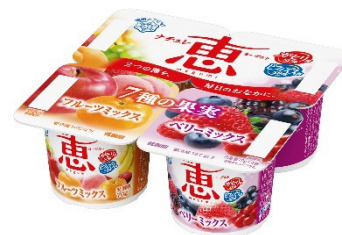
「7種の果実 フルーツミックス +ベリーミックス」 (70g×4個)