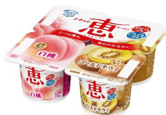
「白桃+ゴールドキウイ」 (70g×4個)