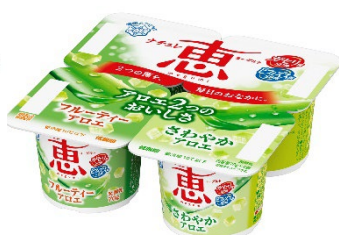
「アロエ2つのおいしさ」 (70g×4個)