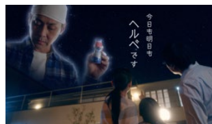
EPISODE. 6 「定着の暁」篇