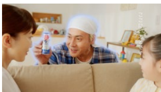
EPISODE. 4 「対面の春」篇