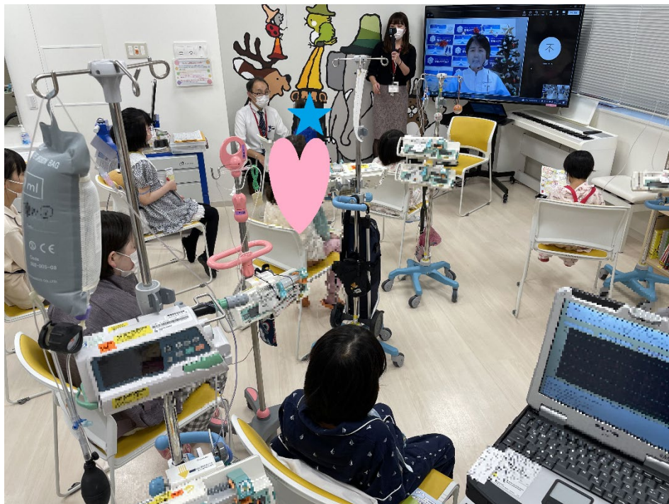
オンライン工場見学の様子

今後も「オンライン」のメリットを最大限に活かし、工場のPR活動を通じて、社会貢献につながる活動を実施してまいります。