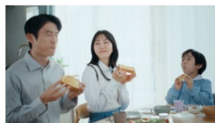
おいしい顔、してくれるじゃない〜