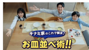
キナミ家のこれで解決！ お皿並べ術！