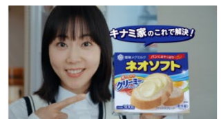
極めつけは…ネオソフト！