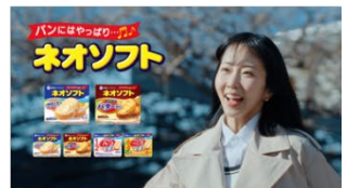
パンにはやっぱりネオソフト♪