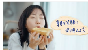
朝を笑顔に塗り変えよう