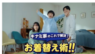
キナミ家のこれで解決！ お着替え術！