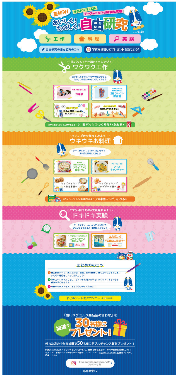
【リーフレットイメージ】