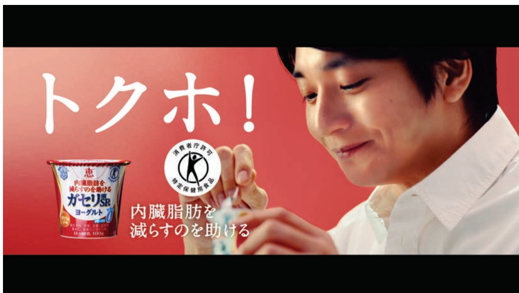
「ガセリ菌SP株ヨーグルト おいしい話」篇TV-CM イメージカット

恵 megumiブランドサイト http://www.megumi-yg.com/