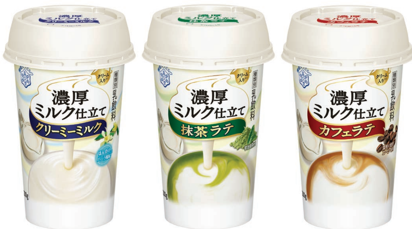
『濃厚ミルク仕立て クリーミーミルク』、『濃厚ミルク仕立て 抹茶ラテ』、『濃厚ミルク仕立て カフェラテ』 各 LL200g

パッケージデザインは、シリーズのこだわりである「クリーム入り」表記をアイコン化し、原材料へのこだわりをより強く訴求しました。また、背景のあしらいを変更し、クリームのシズルを目立たせました。