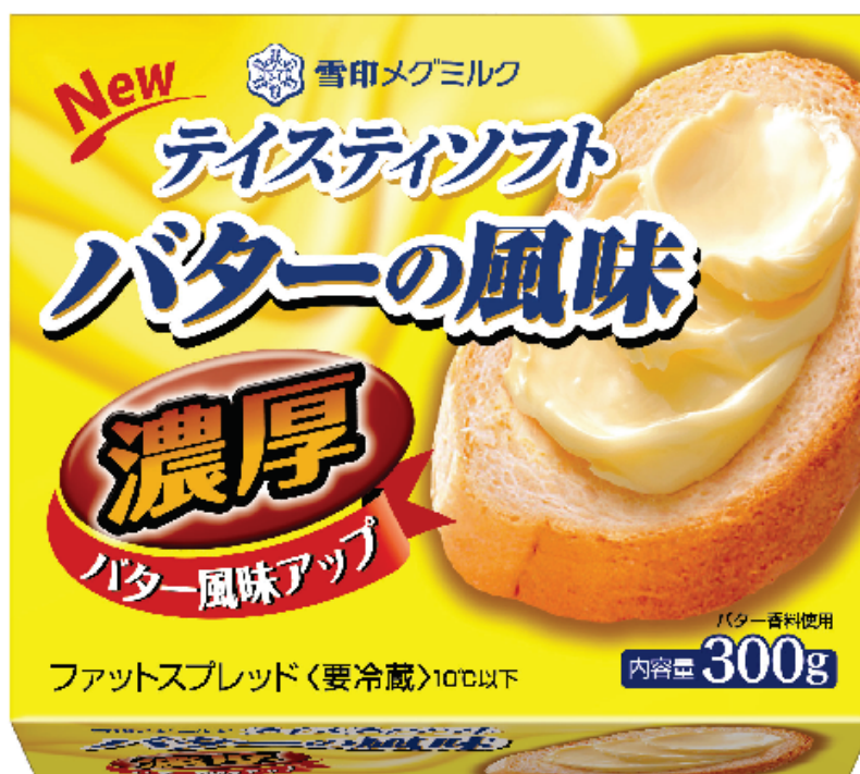
『テイスティソフト バターの風味 濃厚』 300g