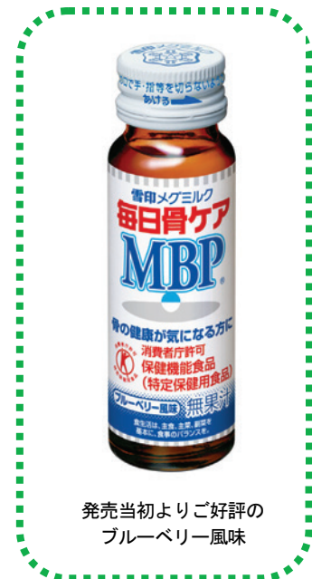
発売当初よりご好評の ブルーベリー風味