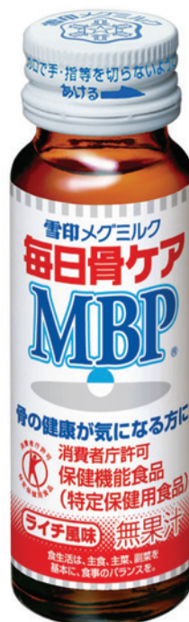
『毎日骨ケア MBP ® ライチ風味』