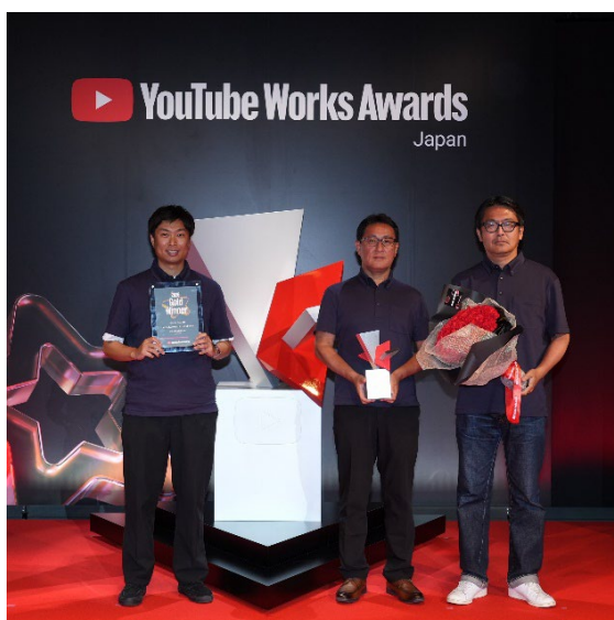
「YouTube Works Awards Japan 2026」授賞式

近年、骨密度低下に起因する骨粗鬆症の増加は、日本が抱える社会課題の一つとなっています。