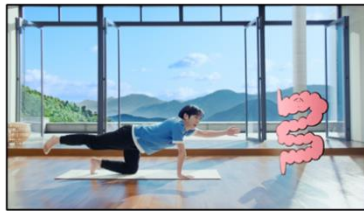
腸さん 「ですよねえ〜」