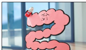
腸さん 「腸すごいでしょ！腸だけに。」