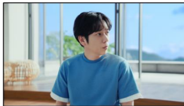
二宮和也さん： ヨーグルトが？ほんと？