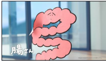
腸さん 「腸ですう。脂肪をつきにくくしたいなら腸を変えればいいんです〜」