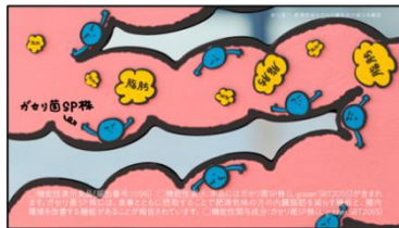
腸さん 「ガセリ菌SP株が腸で脂肪の吸収を抑えますう」