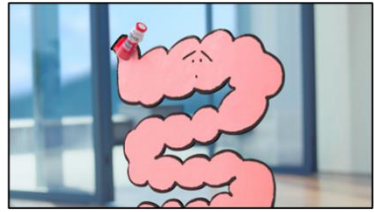
腸さん 「そのカギはヨーグルト！」