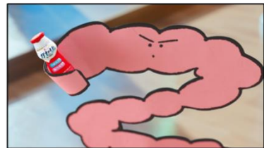
腸さん 「はい！内臓脂肪を減らすのを助けます」