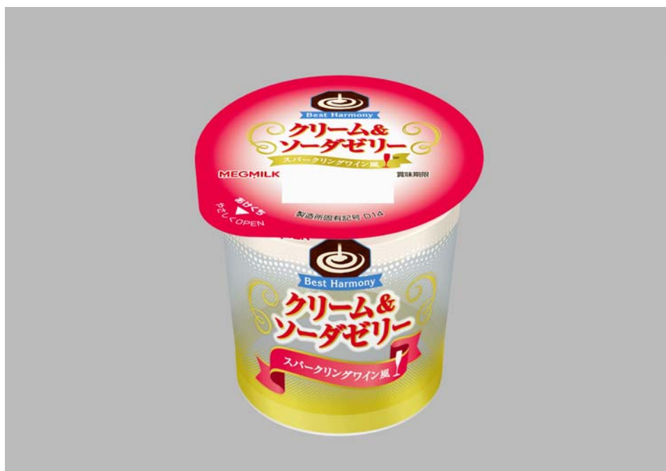
『クリーム&ソーダゼリー スパークリングワイン風』 130g

ソーダゼリーは、スパークリングワインをイメージしたぶどう風味で仕立てました。夏に注目される スパークリングワイン風の上質感で、ちょっと贅沢な気持ちを味わっていただけるデザートです。 アルコール分は使用していませんので、お子様にも安心してお召し上がりいただけます。