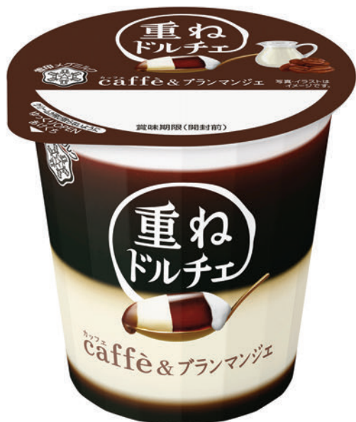
『重ねドルチェ カッフェ caffè&ブランマンジェ』 120g

全体を包みまとめるまるやかクリーム(1層目)を重ねた4層仕立てで、白桃のおいしさを存分に楽しめる組み合わせをお届けします。