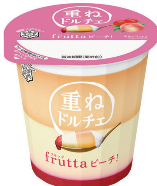
『重ねドルチェ フルッタ fruttaピーチ!』 120g