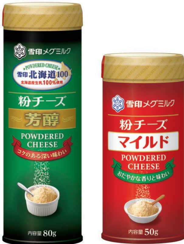
(左より)『雪印北海道 100 粉チーズ芳醇』(80g)、 『粉チーズ マイルド』(50g)

雪印メグミルクでは、お客様からお寄せいただいた一つひとつの声を大切に、その声を活かした商品の開発や改善に努めてまいります。