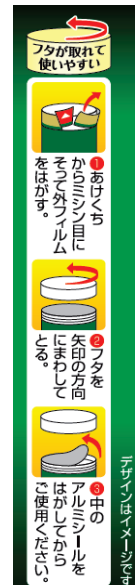
フタの取り外し方のパッケージ表示