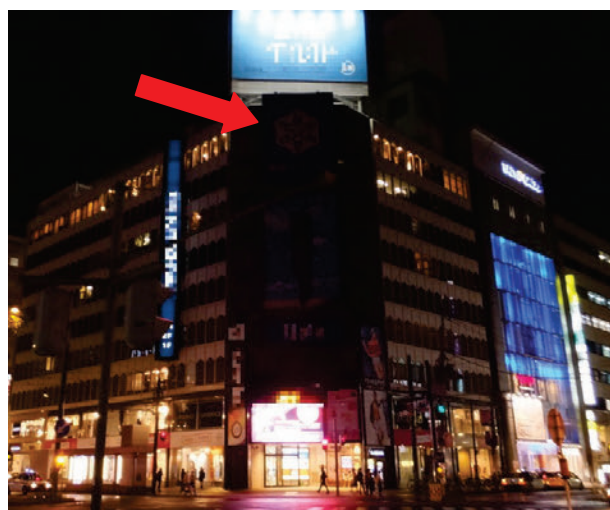
（右）6月21日（夏至の日）のライトダウンの様子