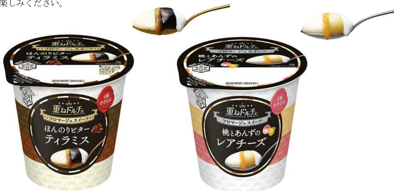
『重ねドルチェ ティラミス』

食後のデザートや、少しゆったりしたいとき、気分転換したいときに、贅沢なデザートタイムをお楽しみください。