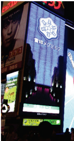
（左）大阪・道頓堀ネオンの通常時の点灯