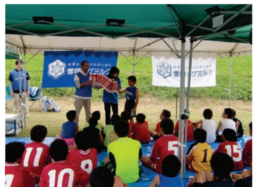
スポーツ食育の様子