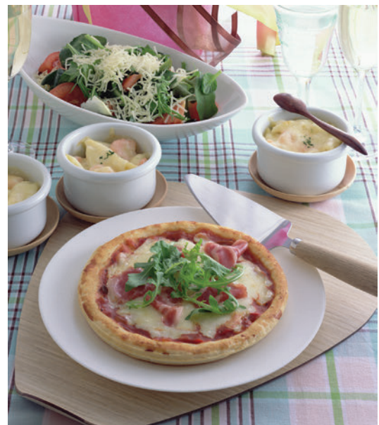
ピザクラストを使用したピザのメニュー例