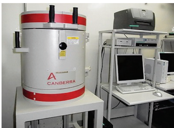
ゲルマニウム半導体検出器

*原料乳、原材料、用水、製品については、ゲルマニウム半導体検出器やヨウ化セシウムシンチレーションカウンターで検査をしています。