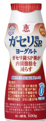
「恵 megumi ガセリ菌 SP 株ヨーグルト ドリンクタイプ」 売上高伸長率