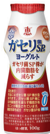
『恵 megumi ガセリ菌 SP 株ヨーグルト ドリンクタイプ』 売上高伸長率 *機能性表示（平成27年8月）前を100とした場合の推移